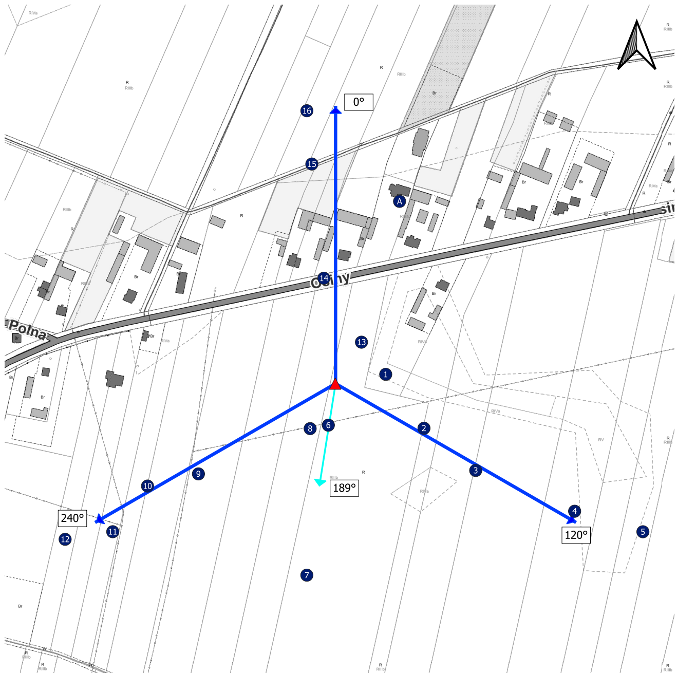
Zał. 2. Widok pionów pomiarowych